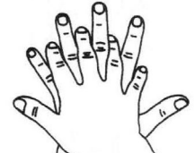
2 - Paume sur dos Désinfection des doigts et des espaces interdigitaux