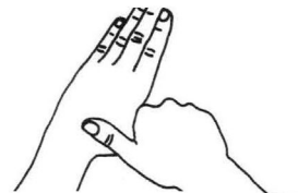
5 - Pouce Désinfection des pouces