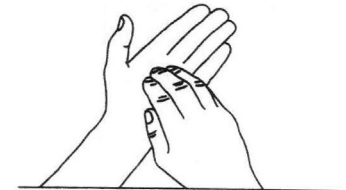
6 - Ongles Désinfection des ongles