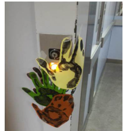
Sur la trace des mains