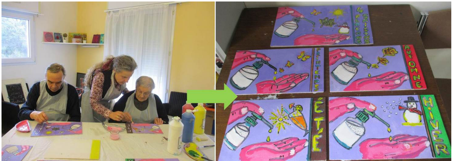
Tableaux des 4 saisons

Depuis début 2017, la FI2H organise des sessions de formations des professionnels paramédicaux à l'hygiène